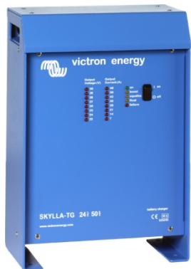
Chargeur Skylla 24 V 50 A