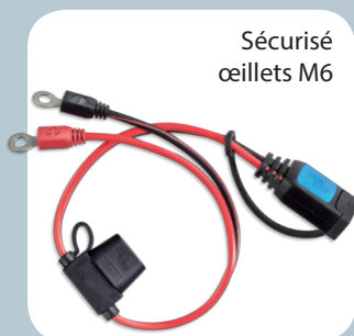
Sécurisé œillets M6